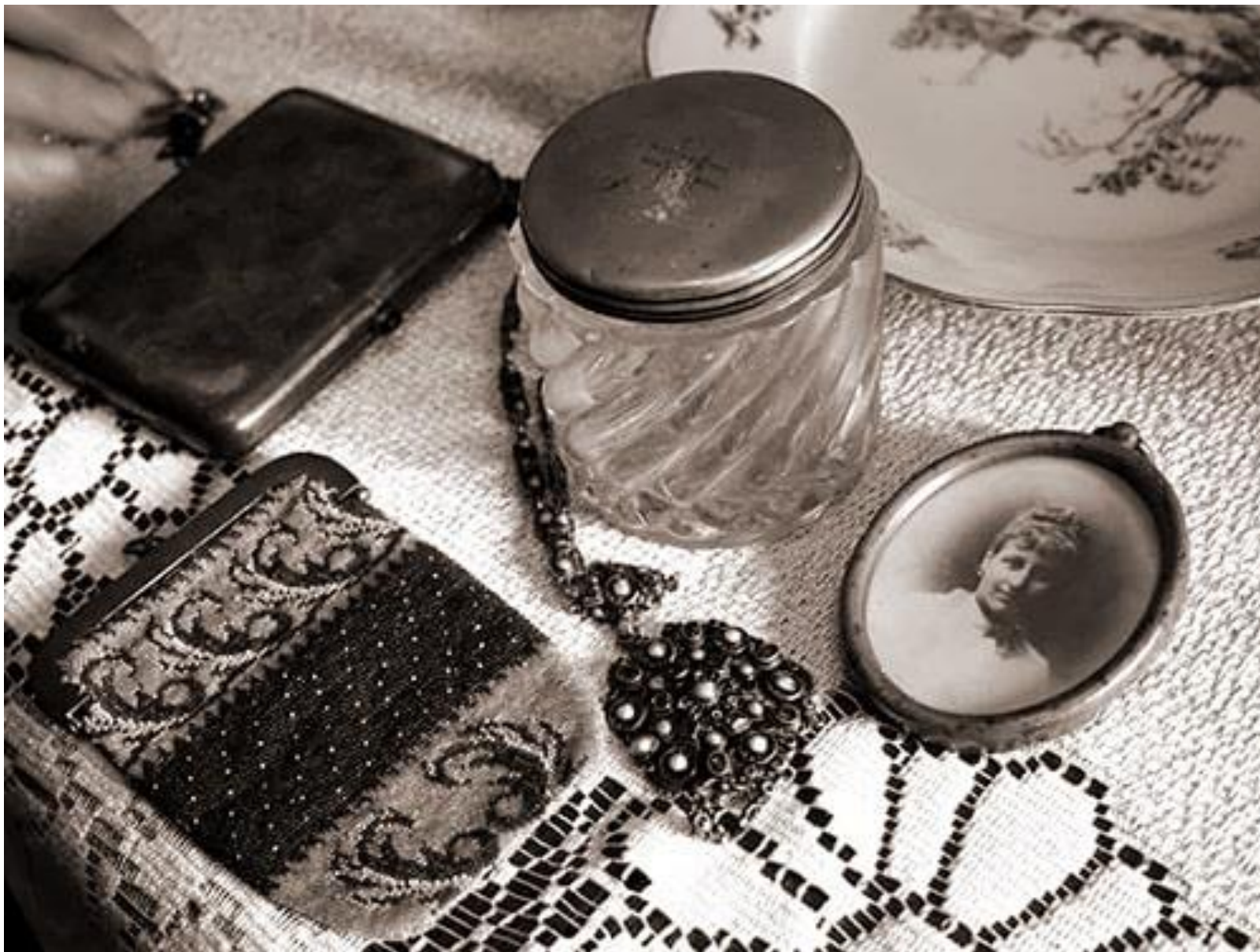
Памятные вещи потомков Пушкина. (2019)

МИНИСТЕРСТВО ОБОРОНЫ РОССИЙСКОЙ ФЕДЕРАЦИИ