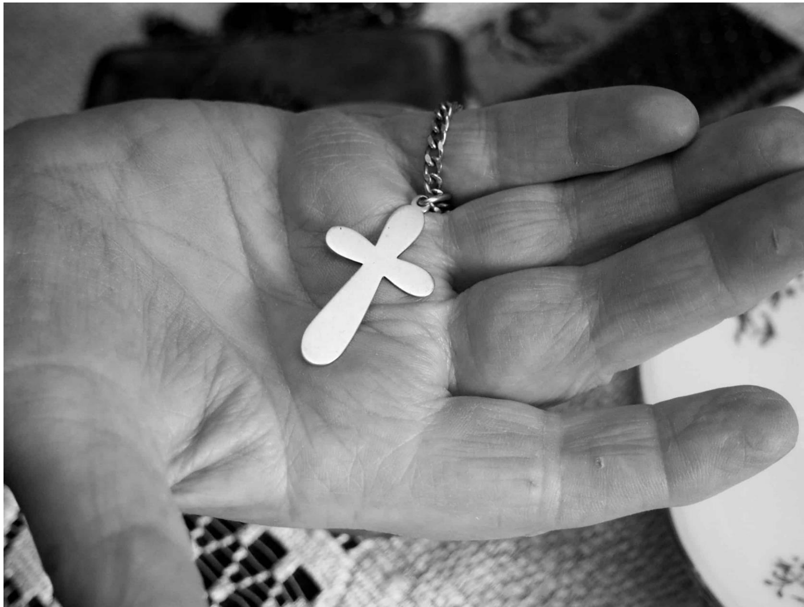
Крест дочери Пушкина Марии Александровны Гартунг. Фото Ирины Ларионовой (2019)

МИНИСТЕРСТВО ОБОРОНЫ РОССИЙСКОЙ ФЕДЕРАЦИИ