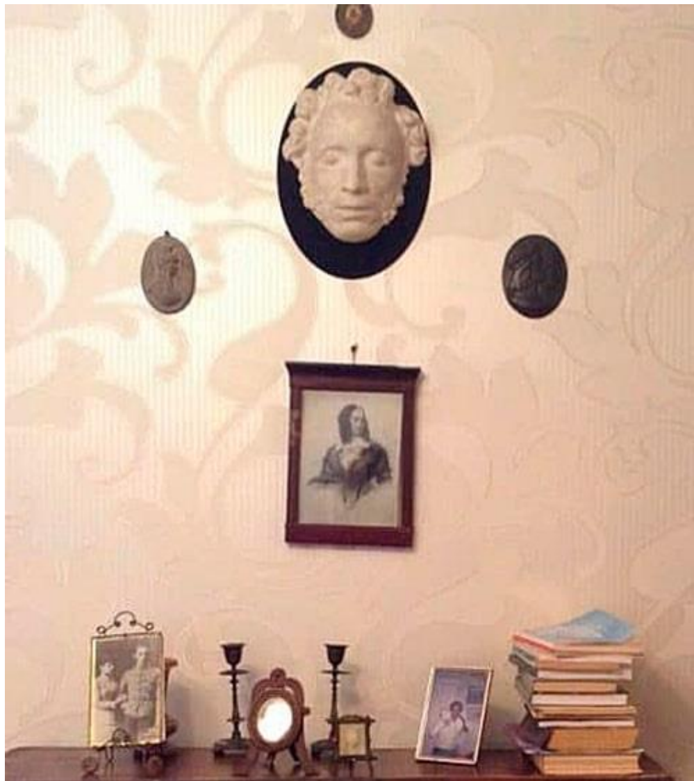
Фото Натальи Мешковой (2017)

МИНИСТЕРСТВО ОБОРОНЫ РОССИЙСКОЙ ФЕДЕРАЦИИ