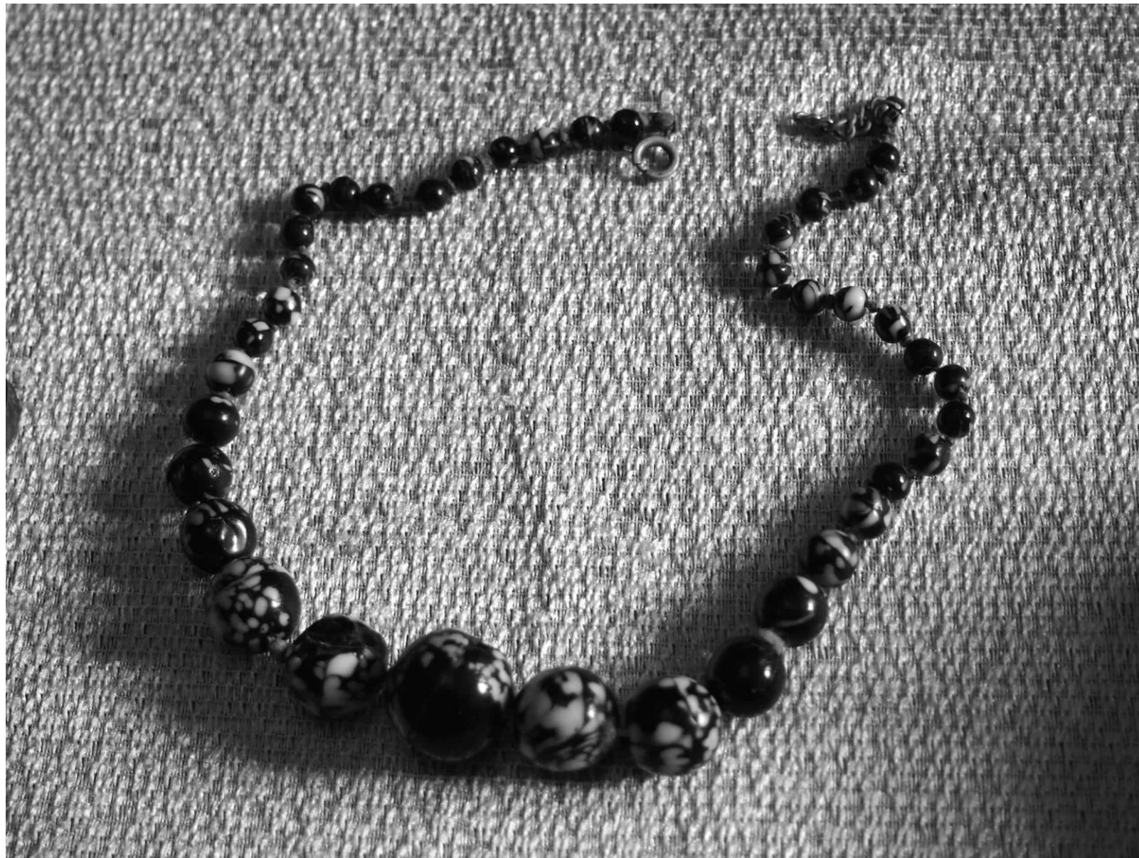
Бусы дочери Пушкина Марии Александровны Гартунг.

МИНИСТЕРСТВО ОБОРОНЫ РОССИЙСКОЙ ФЕДЕРАЦИИ