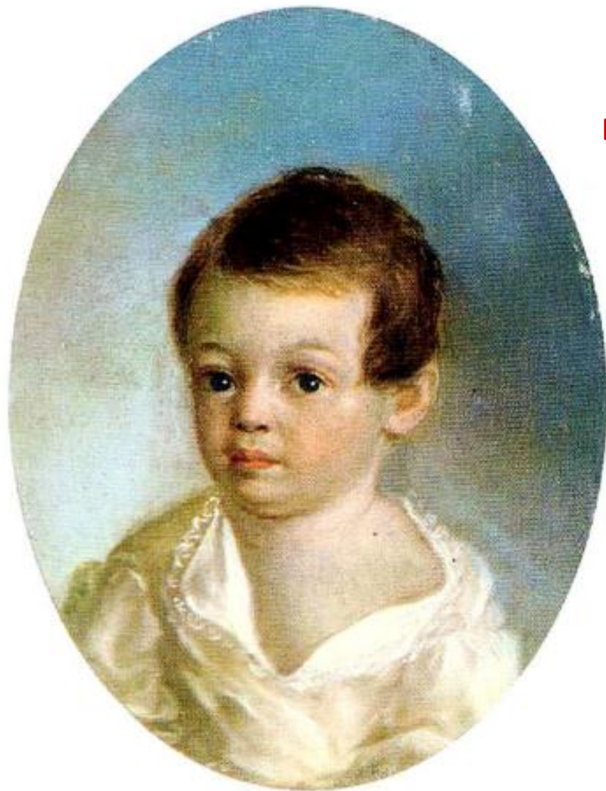
Детский портрет А.С. Пушкина Художник Ксавье де Местр

ПЕТРОЗАВОДСКОЕ ПРЕЗИДЕНТСКОЕ КАДЕТСКОЕ УЧИЛИЩЕ