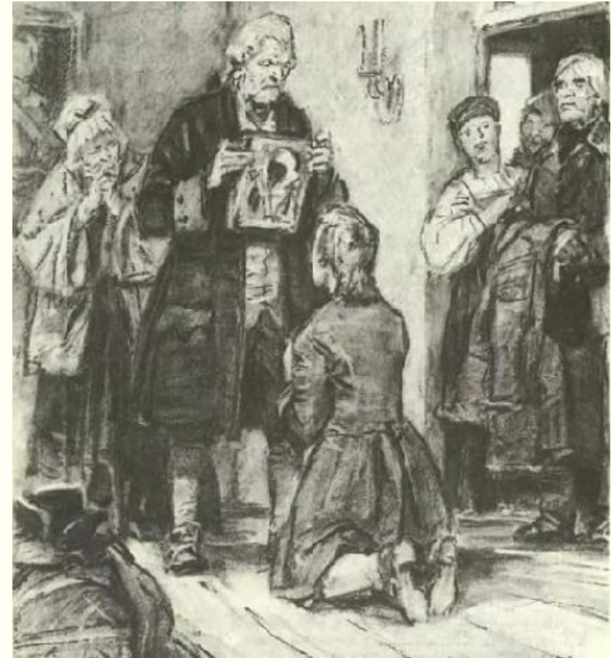
Глава I. Сержант гвардии "Батюшка сказал мне: «Прощай, Петр. Служи верно, кому присягнешь...»"

4 шаг – финальная работа по тексту. Можно предложить ученикам выполнить небольшое эссе, синквейн, подобрать свои пословицы, заполнить таблицу.